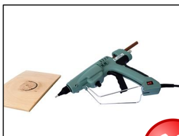
Lægges aldrig på siden!